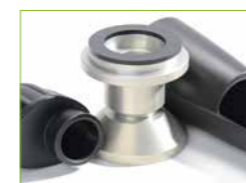
WIR GEBEN GUMMI