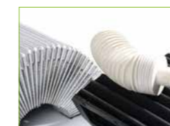
WIR BIETEN SCHUTZ