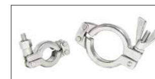
Klammern für DIN 11864-3 / DIN 11853-3