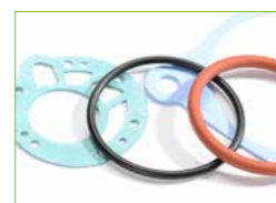
WIR HALTEN DICHT