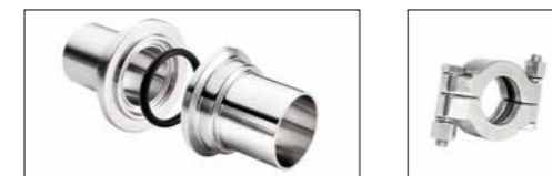
DIN 11864-3 Klemmstutzen

Werkstoff AISI 316L (entspr. 1.4404) Standardoberfläche: Hygieneklasse H3, innen < 0.8µm, aussen < 1,6µm