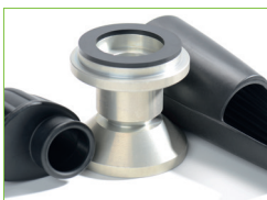
WIR GEBEN GUMMI

In den meisten Fällen genügen die Einbaumasse, der gewünschte Typ und das Material. Den Rest erledigen wir. Bei heiklen Anwendungen fragen Sie unser Technik-Team. Wir konzipieren für Sie Ihr Dichtungssystem nach Mass.