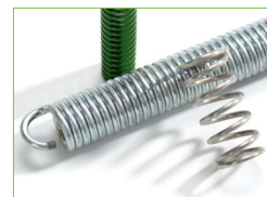
□ WIR MACHEN ES IHNEN FEDERLEICHT