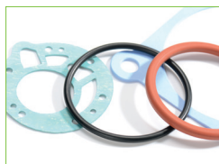
□ WIR HALTEN DICHT