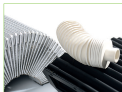
WIR BIETEN SCHUTZ